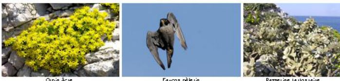
Olivier à fleur